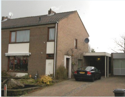
Praktijk Sint Geertruid